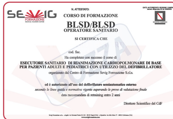
Abilitazione regionale All'utilizzo del AED (in formato elettronico)