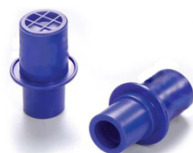
Filtro unidirezionale (per pocket mask)