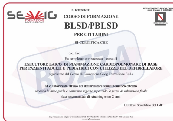
Abilitazione regionale All'utilizzo del AED (in formato elettronico)