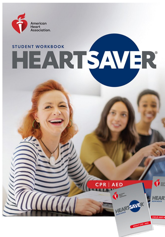
Manuale dello studente (in formato cartaceo o ebook)