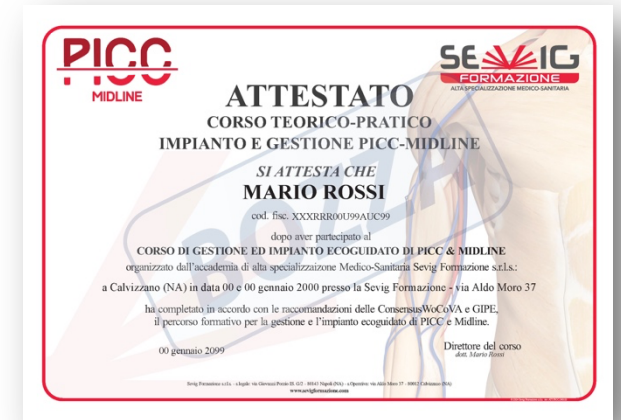
Attestato di Partecipazione (in formato elettronico)