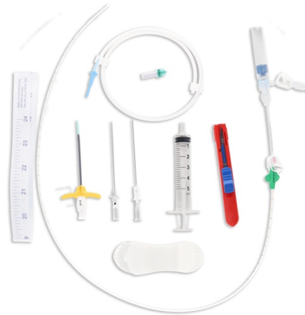
Kit PICC (da utilizzare nelle prove pratiche)