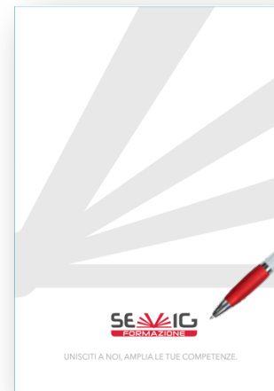
Cartellina e penna